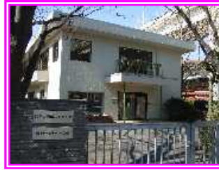
日枝小学校放課後キッズクラブ

今後も子供たちの「安全・安心」を第一に考え特色を活かしたより良い事業運営ができるようスタッフ一同力を合わせて頑張っております。